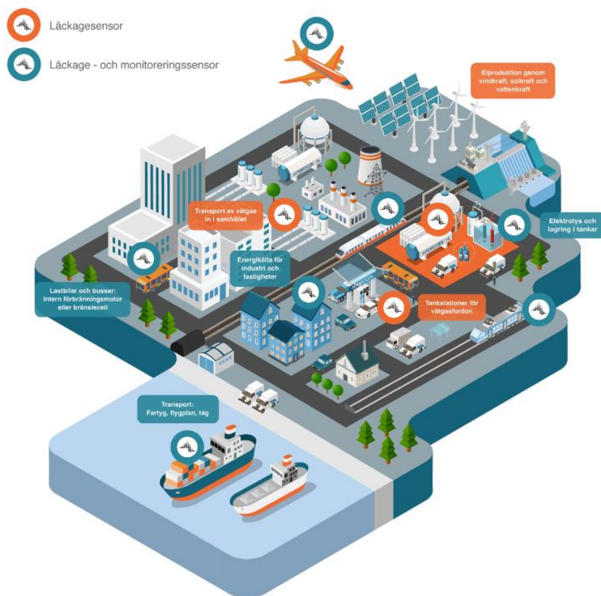
Bild 2: Behov av vätgassensorer för att optimera säkerhet och effektivitet i alla steg av vätgasens värdekedja.

Insplorions försäljning av mätinstrument sker i huvudsak genom distributörer. Bolaget har idag distributörsavtal med distributörer i Kina, Japan, Sydkorea, Storbritannien, Irland, Polen, Tyskland, Österrike, Portugal, Australien och Nya Zeeland.