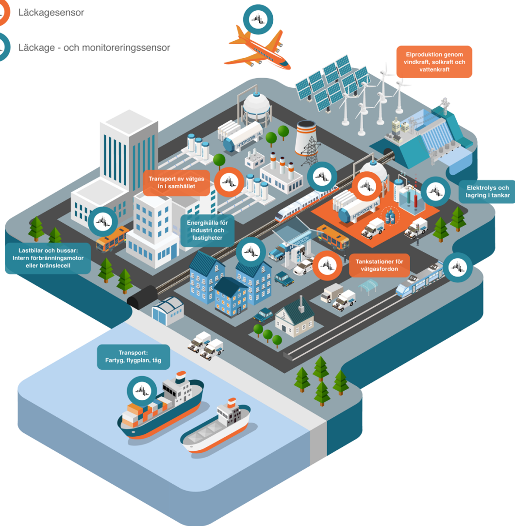
Bild 1: Behov av vätgassensorer för att optimera säkerhet och effektivitet i alla steg av vätgasens värdekedja. 6